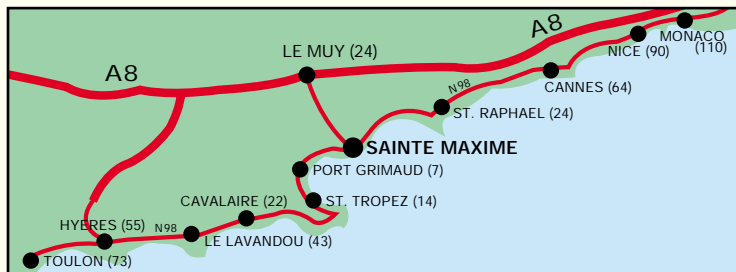
Tallene i parantes angiver km fra Sainte Maxime

PRISER , vilkår og andre faktuelle oplysninger er beskrevet i bilag til brochuren. Vi er meget gerne behjælpelig med yderligere information ved henvendelse til Via France A/S eller Hotel Lou Paouvadou.