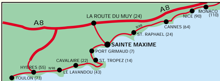
Distances en kilomètres à partir de Sainte Maxime

TARIFS , les conditions de votre séjour ainsi que d'autres renseignements pratiques vous sont décrits sur les pièces ci-jointes. Si vous désirez des informations supplémentaires, n'hésitez pas à nous contacter à l' Hôtel Lou Paouvadou.